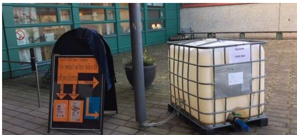
Vattentanken vid entrén synliggör vikten av att vara varsam med vatten.

De elever som deltar går första året på natur-, ekonomi- och samhällsprogrammen. Under senare år har även en klass med elever nyanlända till Sverige deltagit.