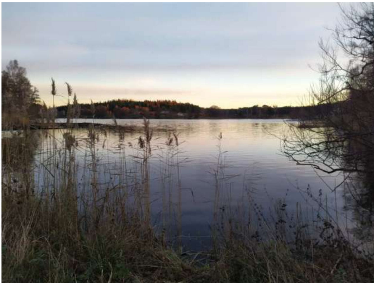
Foto på framsidan av backsippor i maj och bilden nedan från Rönningesjön.